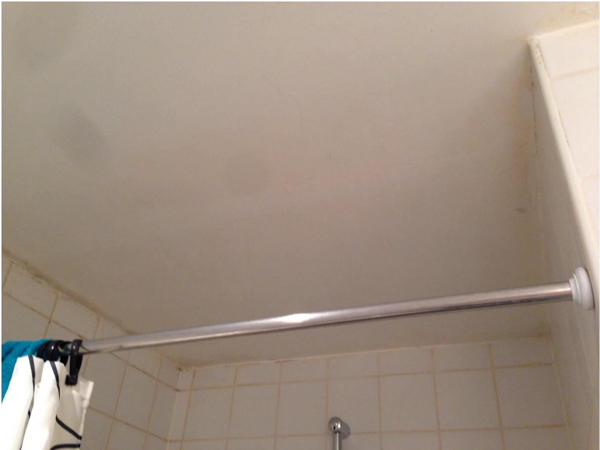
Badkamerplafond 3 – detail oneffenheden