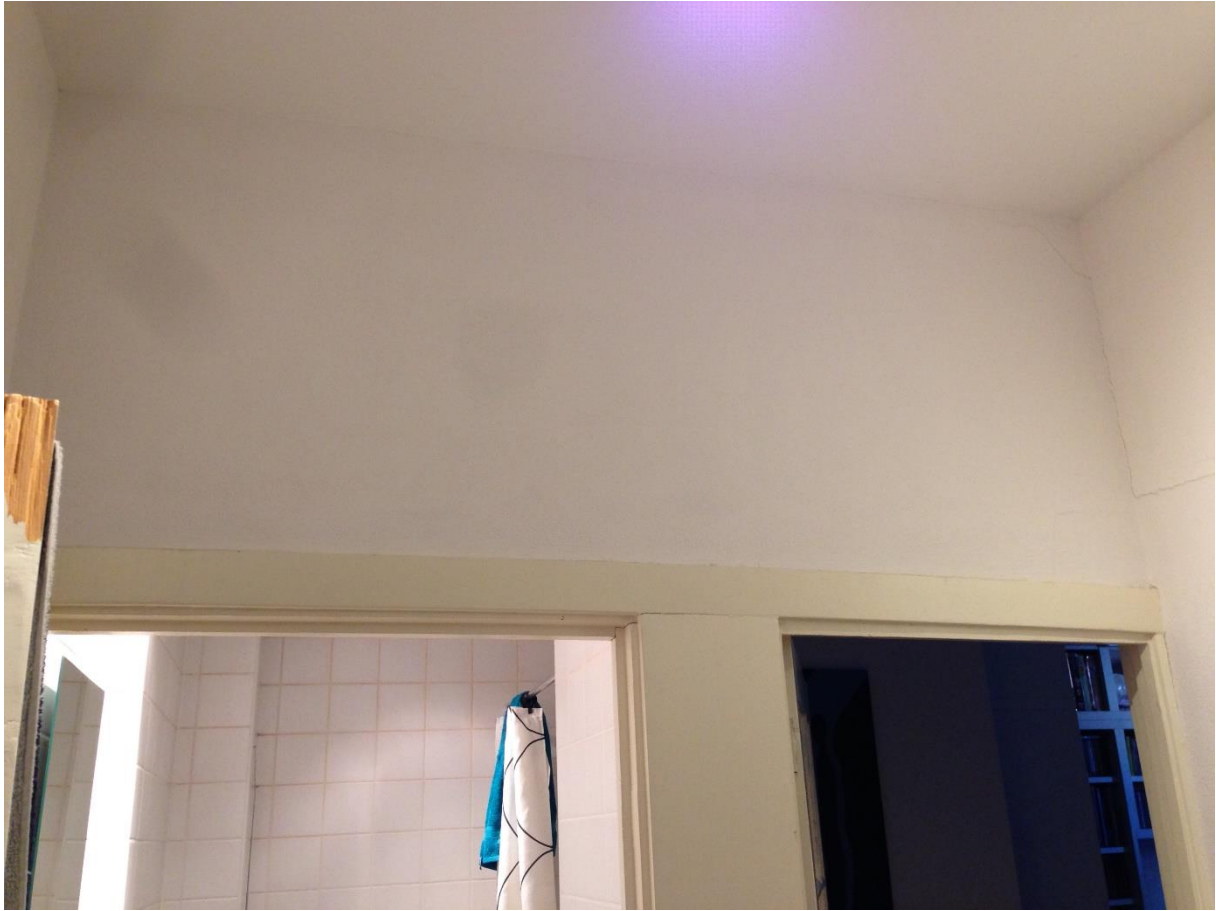
Gang 2 - muur rechts (met scheur)