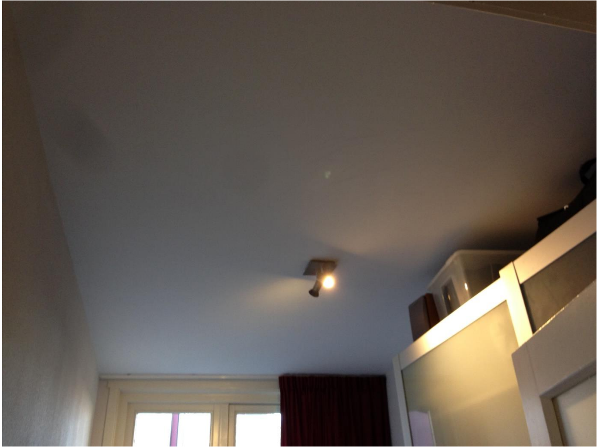
Slaapkamer plafond 2