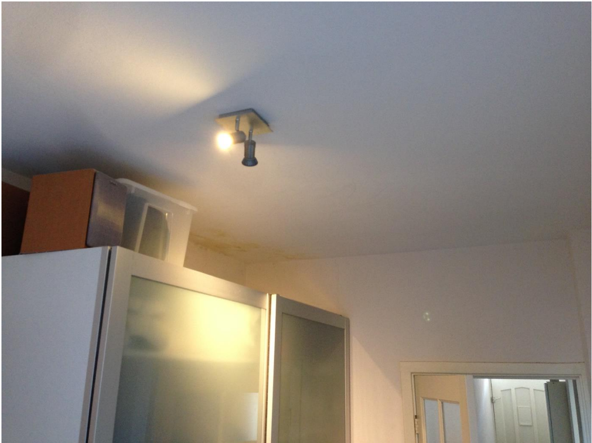
Slaapkamer plafond 3 – detail lekkage